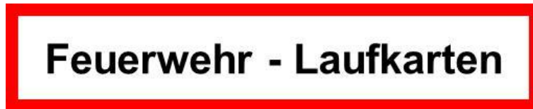
Abbildung 1: Beispiel für Kennzeichnung des Aufbewahrungsortes von Feuerwehr-Laufkarten

Der Aufbewahrungsort ist durch ein Hinweisschild nach DIN 4066 zu kennzeichnen.