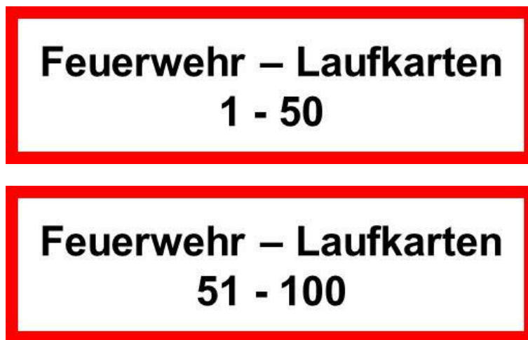
Abbildung 2: Beispiel für Kennzeichnung bei mehreren Aufbewahrungsorten von Feuerwehr-Laufkarten

Übersteigt die Anzahl der Laufkarten den Wert 50, so ist ein weiterer gegen unberechtigten Zugriff geschützter Aufbewahrungsort zu installieren. Alle Aufbewahrungsorte sind dann zusätzlich wie folgt zu kennzeichnen: